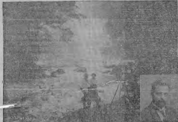
UNA DE LAS MAS HERMOSAS CASCADAS DEL CAUDALOSO RIO BARRANCAS, CUYAS AGUAS SE UTILIZAN PARA LA GRAN PLANTA ELECTRICA EN EL MEDALLON EN EL RETRATO DE DON FEDERICO O HOPKINS.